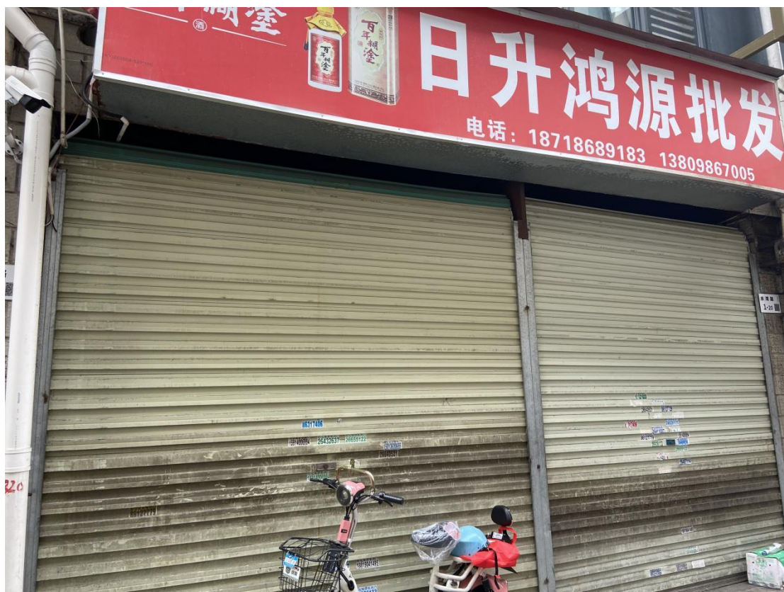
标的照片 赤湾小店